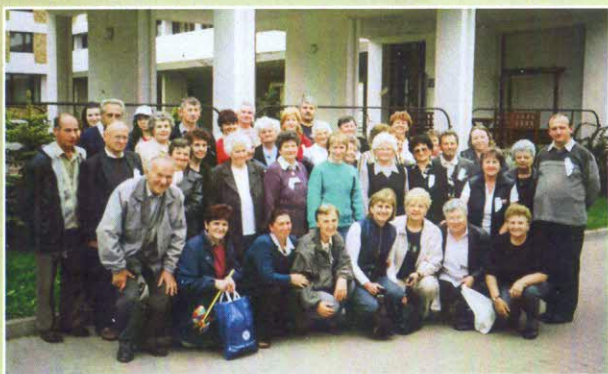
Čenstochova, rok 2006 púť k Matke Božej na Jasnú Góru, najvýznamnejšie pútnické miesto Poľska.