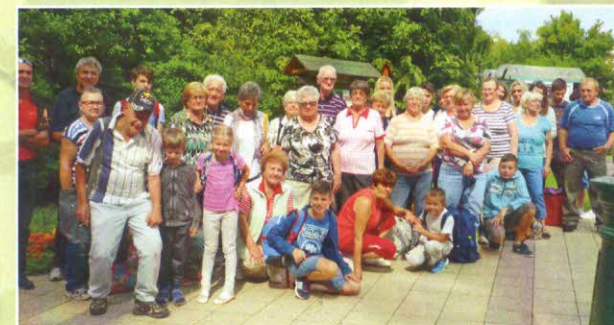
Po duševnej obnove na našich pútiach, sme sa posilnili aj v teplých vodách na kúpalisku v Miskolci.