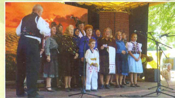
Klub kresťanských seniorov, pri vystúpení z príležitosti 800. výročia, prvej zmienky o obci Barca.