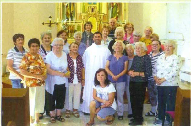
Krásnou akciou pre nás bola aj jednodňová púť do našej diecéznej svätyni Panny Márie v Obišovciach.