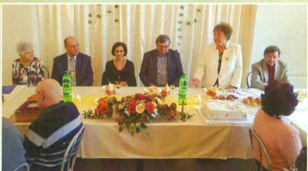
15. Výročie založenia nášho klubu kresťanských seniorov.