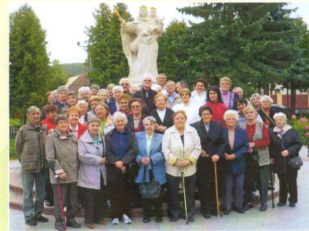
Ružencová záhrada vo Vyšnej Šebastovej. Po modlitbe sv. ruženca, sme mali aj odborný výklad o výstavbe a činnosti Ružencovej záhrady.