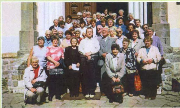
Levoča, rok 2006. Mariánska hora, miesto ďakovania Levočskej Panne Márii a prosieb o pomoc a útechu.