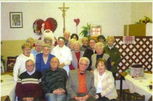
Každý rok k nám zavíta Mikuláš s anjelikom a samozrejme aj s bohatou nádielkou darčiekov, pre našich seniorov.