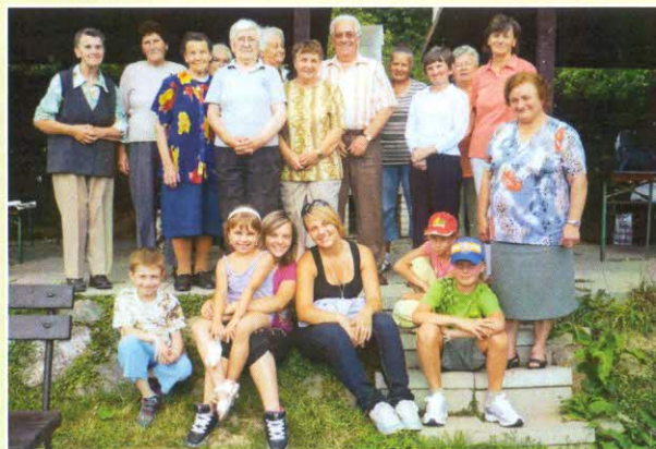
Opekačka na Bankove v roku 2008 aj s našimi vnúčatkami.